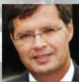
Jan Peter Balkenende Hoogleraar Bestuur, Instuties en Internationalisering aan de Erasmus Universiteit